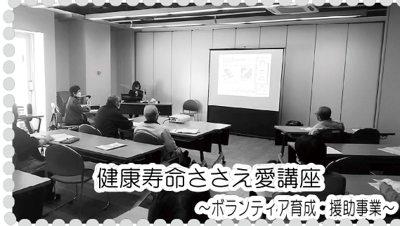
健康寿命ささえ愛講座