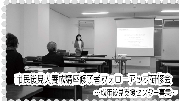
市民後見人養成講座修了者フォローアップ研修会