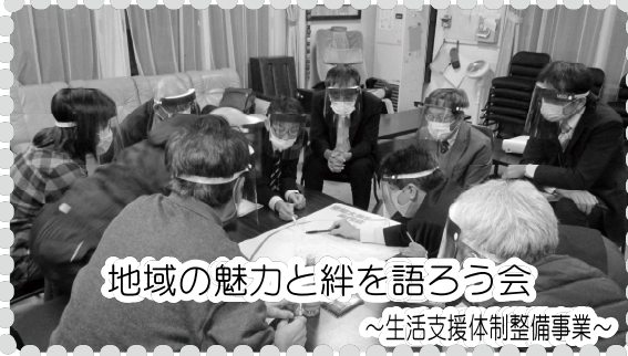
地域の魅力と絆を語ろう会