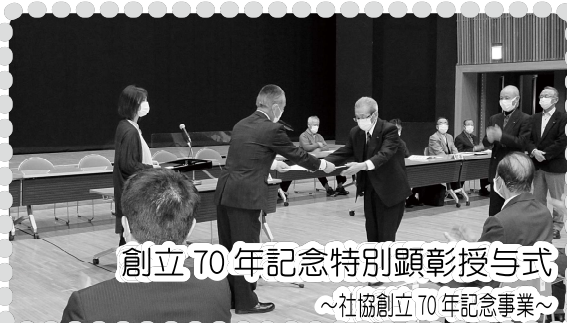
創立70年記念特別顕彰授与式