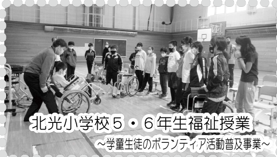
北光小学校5・6年生福祉授業