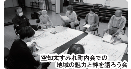
空知太すみれ町内会での地域の魅力と絆を語ろう会

町内会等のご協力により開催した『地域の魅力と絆を語ろう会』で把握した課題をもとに、ひとり暮らしの高齢者が元気で安心して暮らすために大切な項目を掲載したチラシを作成し配布するなど、住民同士の支えあい活動が、より充実するための事業を行っています。