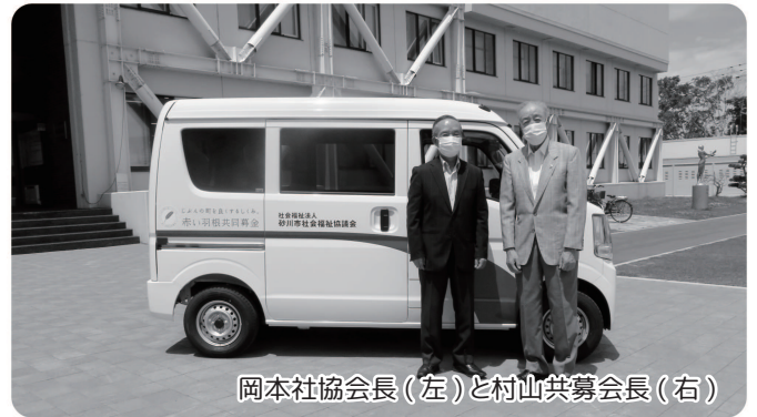
岡本社協会長(左)と村山共募会長(右)