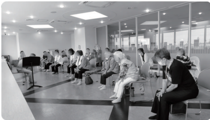
↑ いきいき体操 レクリエーション →

受付のほか、運動やレクを参加者と一緒に楽しんでくれる ボランティア を募集しています！詳しくは、社会福祉協議会までご連絡ください！