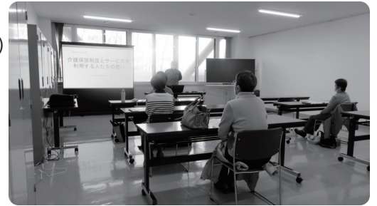
『健康寿命ささえ愛』講座

市内居住の高校生、または砂川高校在学学生を対象に、福祉や高齢・障がいに関する講義や、市内福祉施設のご協力にて、入所・通所者との交流を通じたボランティア体験を実施しています。